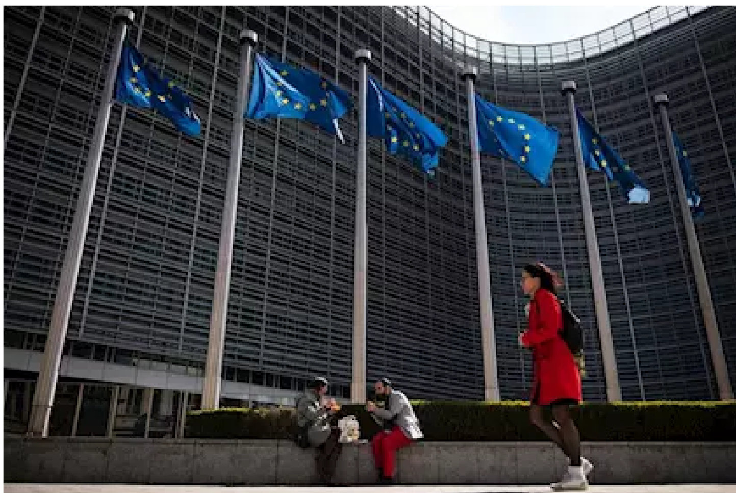
Banderas de la UE en Bruselas