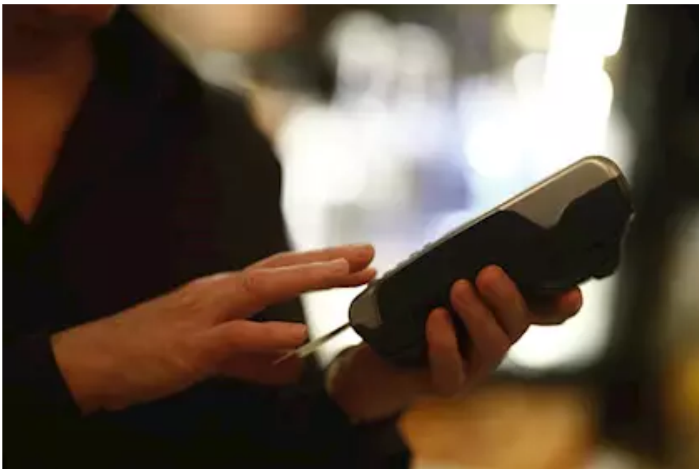
Imagen de recurso de un datáfono y una tarjeta de crédito.