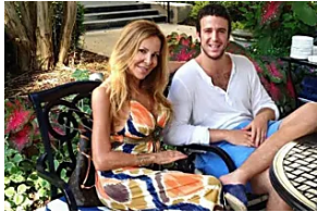
Álex Lequio sufre una nueva recaída de su cáncer y cancela un evento solidario