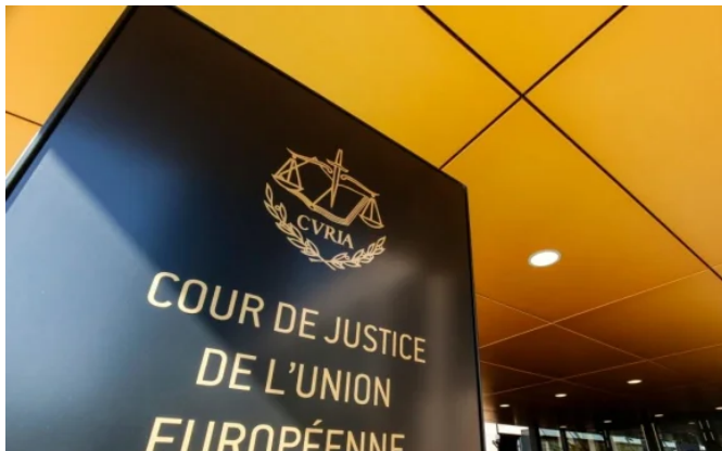
La banca teme que la sentencia del IRPH 'contamine' el cierre del ejercicio 2019.

Incertidumbre total al respecto del Índice de Referencia de Préstamos Hipotecarios (IRPH) . Han pasado ya cuatro meses desde que el abogado general del Tribunal de Justicia de la Unión Europea (TJUE) presentó sus conclusiones y todavía no hay publicada una fecha para la lectura de la sentencia, lo que inquieta a las entidades financieras , que temen que el fallo tenga lugar justo antes de la formulación de sus cuentas anuales, lo que obligaría a la banca a aplicar ajustes de última hora sobre las mimas.