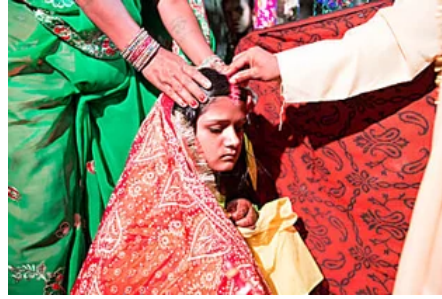
Firma y suma tu voz contra el matrimonio infantil