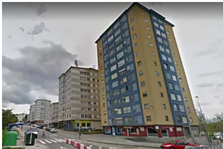
Defensa vende sin subasta pisos desde 26.000€ procedentes de pujas desiertas