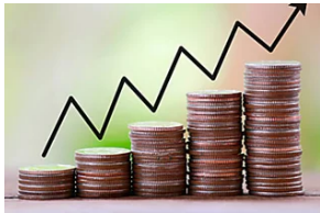
Saca partido a tus ahorros como lo hace Mutua Madrileña