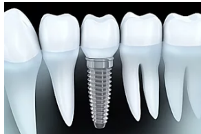
Esto es lo que podrían costar los nuevos implantes dentales en España