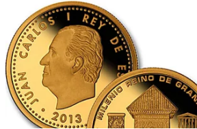
Si tienes estas monedas históricas las puedes vender por 1.600 euros